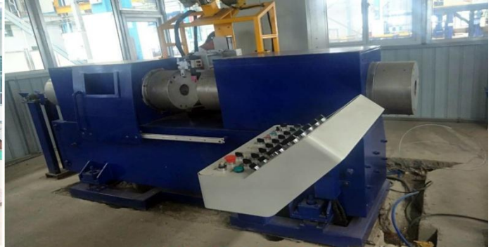
大型管管对接设备