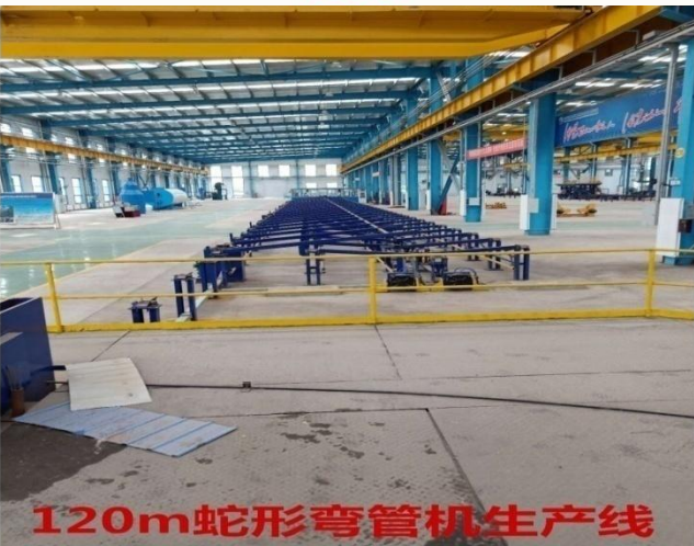
120m蛇形弯管机生产线