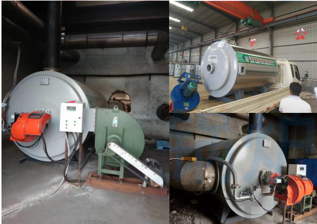
大连新春多品种盐有限公司施工现场