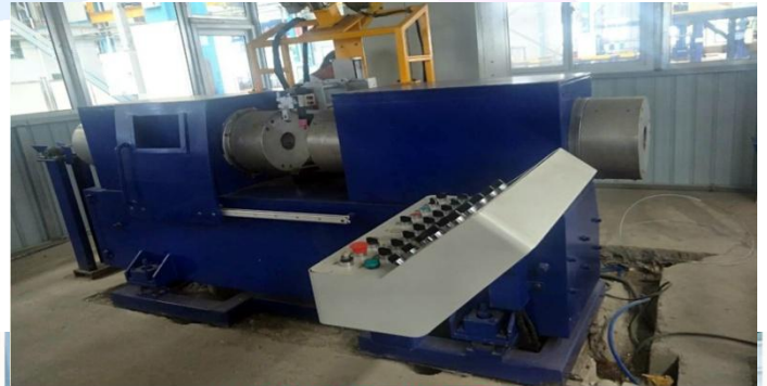
大型管管对接设备