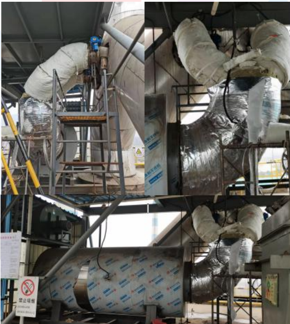
湖北中环信环保科技有限公司施工现场