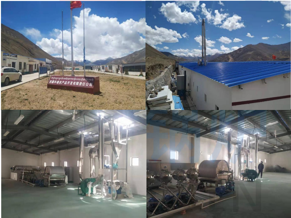
西藏年雄农产品开发有限责任公司施工现场