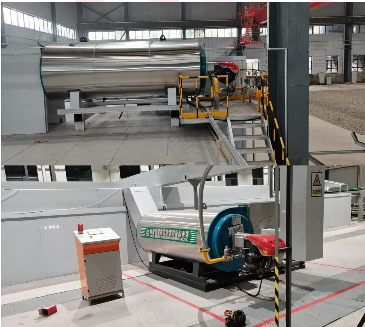
北京博智兴业科技有限公司施工现场