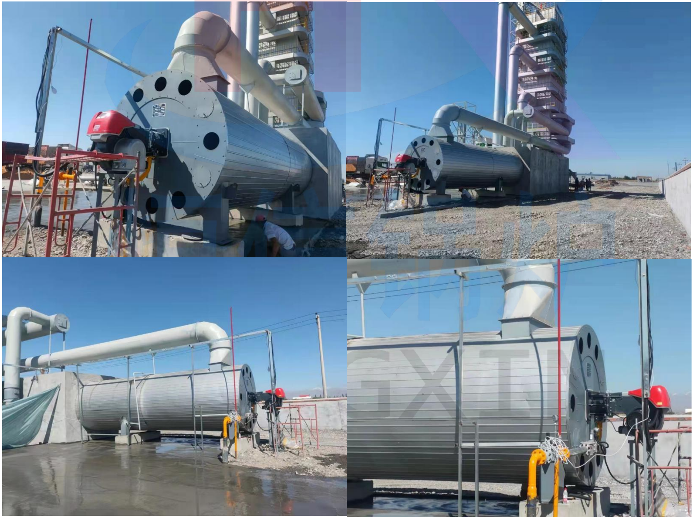
厦门市碧草源进出口有限公司国外施工现场