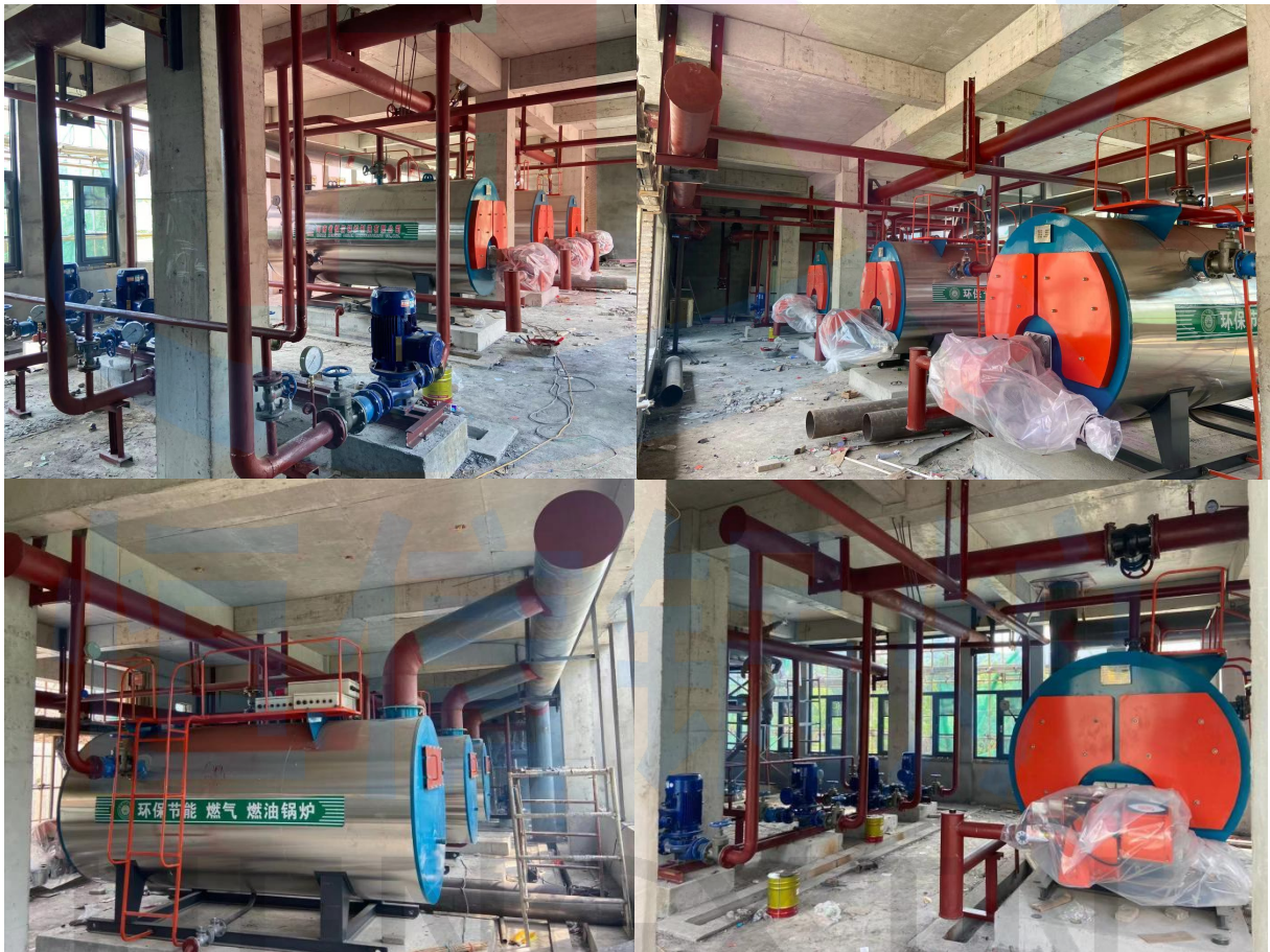
陕西建工第十建设集团有限公司施工现场