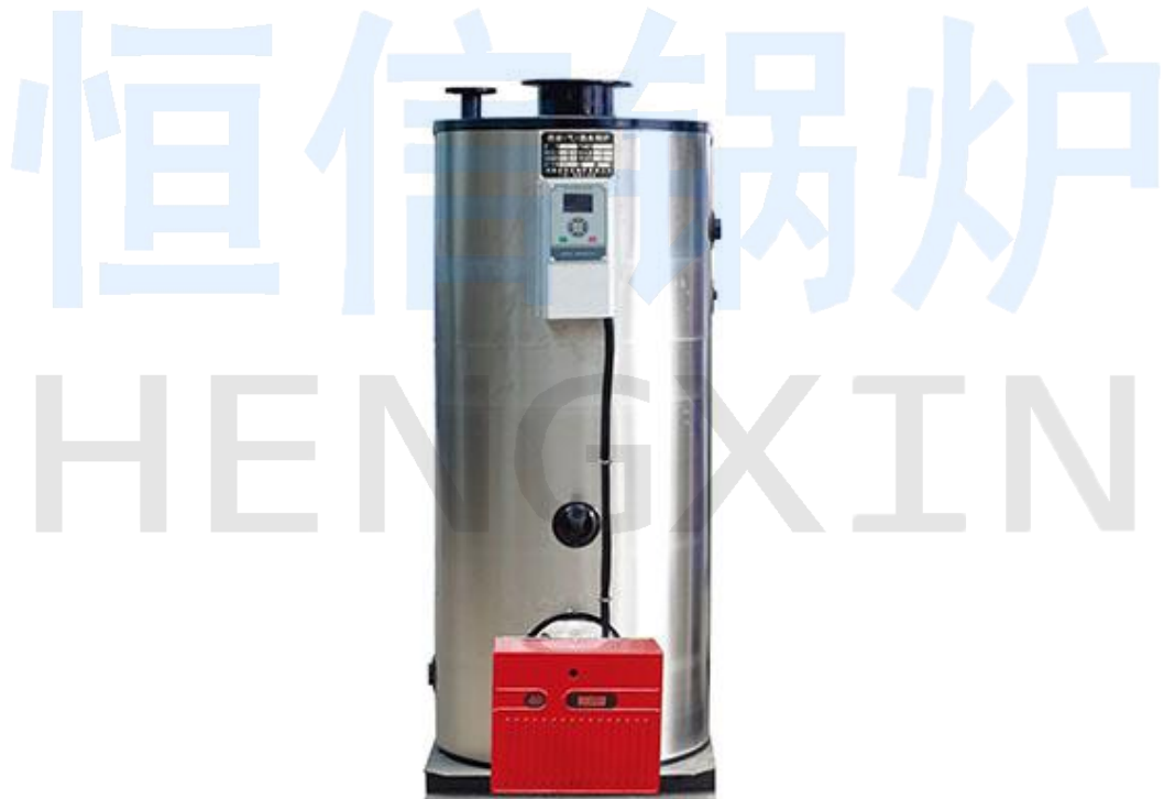
惠州市盛威热能科技有限公司施工现场