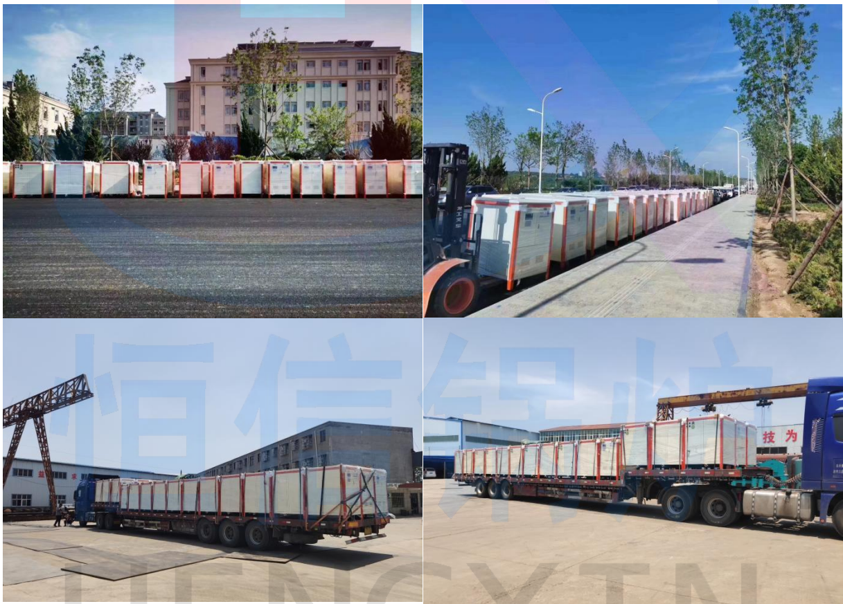
威海荣海节能科技有限公司到货现场